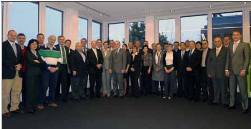
Imagen de la reunión de SUGEN en Walldorf, donde asistieron 40 representantes de 14 asociaciones de usuarios del mundo y de SAP.

Entre las propuestas de futuro que nos planteamos para el próximo año están: