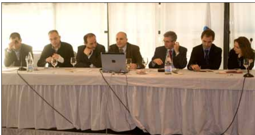
Mesa Redonda de Coordinadores de los Grupos de Trabajo definidos en AUSAPE.

A continuación se inició un repaso de la actividad de cada uno de los Grupos de Trabajo definidos en AUSAPE, en el que los respectivos coordinadores comentaron con los presentes las iniciativas que se han puesto en marcha y los objetivos que se desean alcanzar para siguiente año.