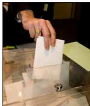
Proceso de votación para la elección de la Junta Directiva.