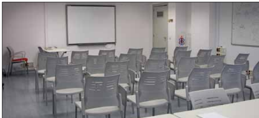
La nueva Sala de Reuniones de AUSAPE servirá para albergar presentaciones y eventos, además de ofrecer soporte para los Grupos de Trabajo.

Este espacio AUSAPE dispone de una superficie útil de 48 m2 y permitirá, por ejemplo, albergar reuniones para una asistencia máxima de 45-50 personas en formato teatro.