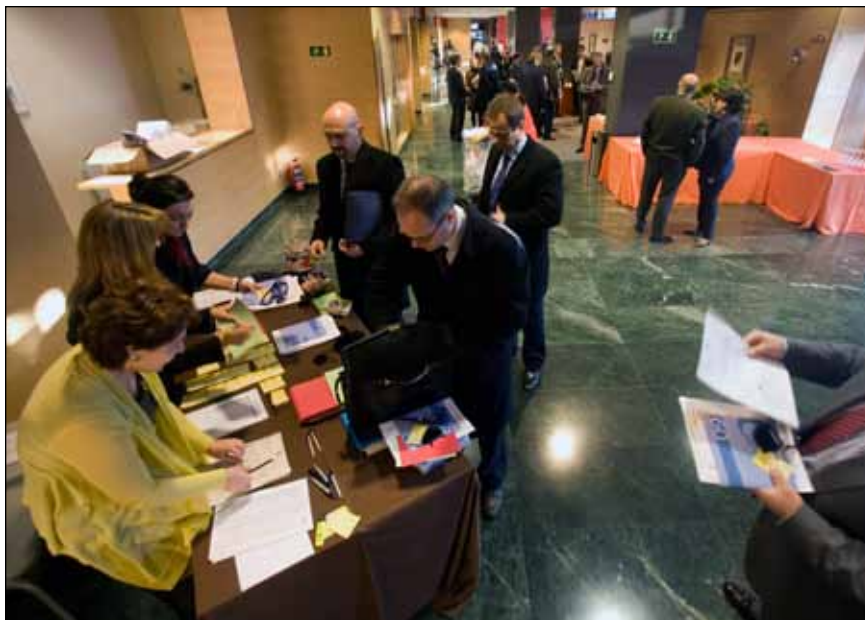
Proceso de inscripción para la XVI Edición de la Asamblea General AUSAPE.