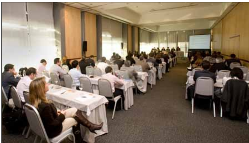
Como viene siendo habitual, en esta XVI Asamblea General se hizo público un informe sobre la gestión realizada el pasado año por la Junta Directiva de AUSAPE.

Después de esta amplia exposición, tomaron la palabra los diferentes miembros de la Junta Directiva que, divididos por Comités, explicaron los detalles que conciernen a cada una de sus áreas de responsabilidad.