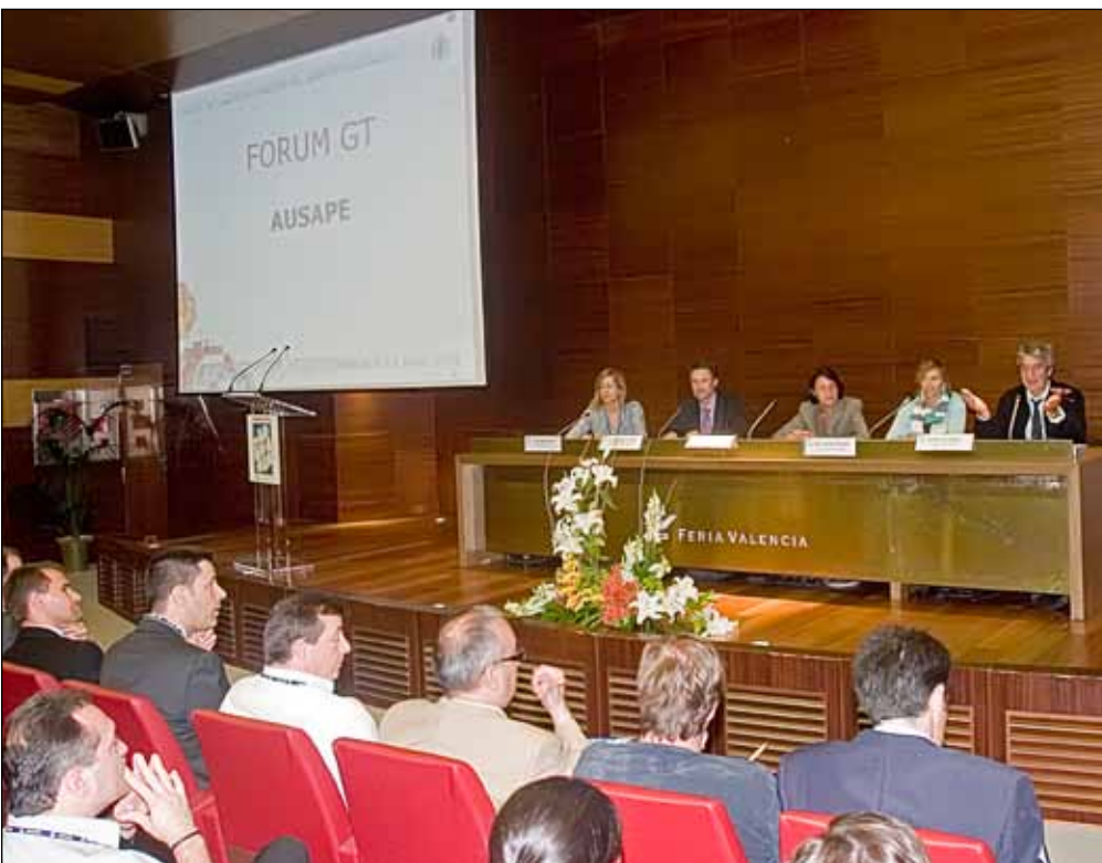
Durante el segundo día se preparó una última Sesión Plenaria, en la que los coordinadores de los Grupos de trabajo plantearon una serie de cuestiones frente a representantes de SAP.

Por último, ofreció una visión más enfocada a destacar las bondades de los Enhancement Packages, un concepto probado ya en el entorno productivo de más de 6.500 clientes y que está diseñado para reducir el conflicto entre estabilidad e innovación, permitiendo a las empresas poner en marcha nuevas capacidades sin que se interrumpa su operativa cuando actualicen los sistemas.