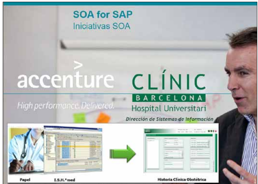
El fallo del jurado premió al proyecto "Historia Clínica Obstétrica", presentado por el Hospital Universitario Clínic i Provincial de Barcelona y su socio tecnológico Accenture.

trabajo para el taller y éste informa sobre su evolución y disponibilidad. Este proyecto, además de eliminar el uso del papel, ha permitido reducir los tiempos de comunicación de averías al mínimo, optimizando la información sobre el estado real de la flota.