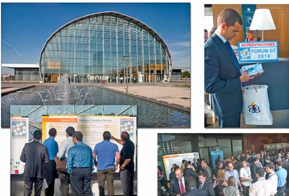
La VI edición del FORUM GT se celebró en el Centro de Eventos de Feria Valencia y fue capaz de congregarse a más de 350 personas relacionadas con el mundo SAP.

La edición de este año se ha presentado con un formato de éxito ya probado, planteando una primera jornada específicamente dedicada a dar cabida a la mayoría de las ponencias magistrales y talleres prácticos, para culminar con una segunda jornada pensada para las reuniones de los Grupos de Trabajo.