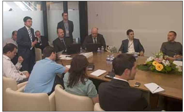
En la reunión programada por el Grupo de Trabajo de SOA se realizó la exposición de los proyectos finalistas en el "I Concurso AUSAPE de Iniciativas SOA".

reuniones del Grupo de Trabajo, en las cuales la esencia era la difusión de SOA, han creído interesante organizar un evento de estas características para mostrar iniciativas realizadas en clientes de SAP y asociados de AUSAPE. El concurso permitió observar diferentes maneras de adaptación de SOA en organizaciones en el contexto de las soluciones SAP.