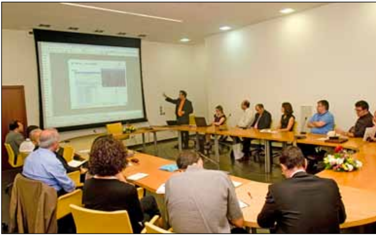
El Grupo de Trabajo BI-BOBJ acaparó un elevado nivel de atención. Normalmente, en sus reuniones se realizan interesantes presentaciones sobre Business Intelligence.