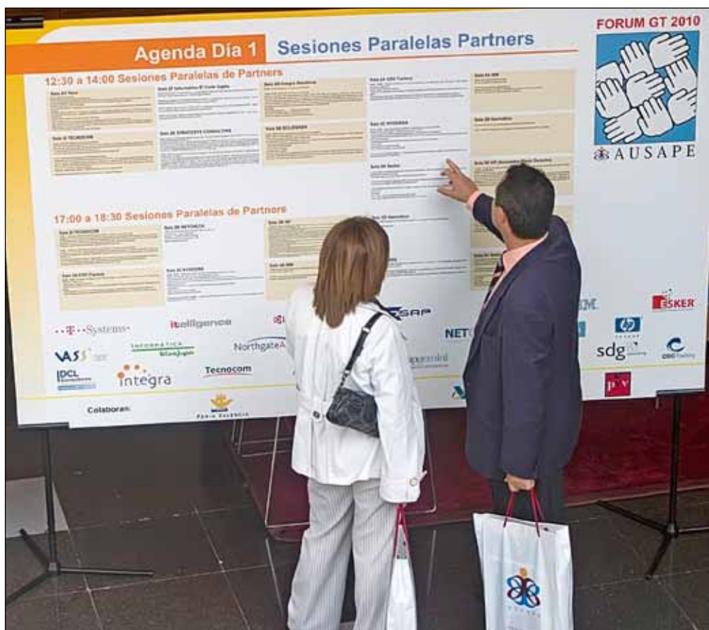
Las Sesiones Paralelas organizadas por más de 20 partners tecnológicos, ofrecieron información de primera mano sobre todo tipo de temas de máxima actualidad.

les beneficios la arquitectura SOA, el uso de mejores prácticas (paquetes Best-Run Now), la posibilidad de poner en práctica procesos de innovación sin disrupción o la reducción que es capaz de conseguir en cuanto al TCO, por ejemplo, a través de una UI armonizada en las aplicaciones y procesos.