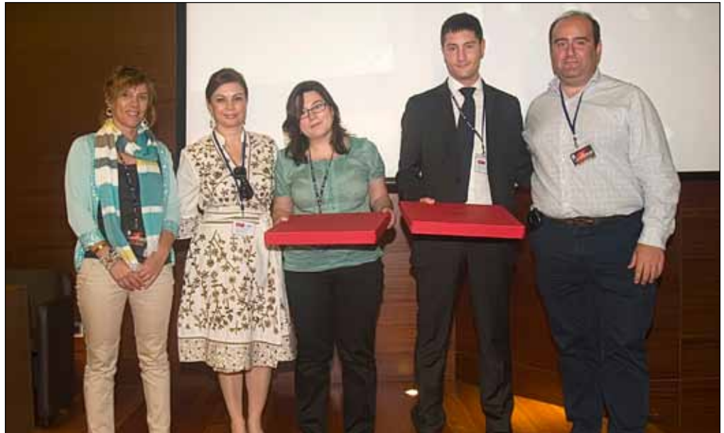
La entrega de este galardón se realizó durante la Sesión Plenaria organizada para la segunda jornada, la enfocada a los Grupos de Trabajo, de la pasada edición del FORUM GT.